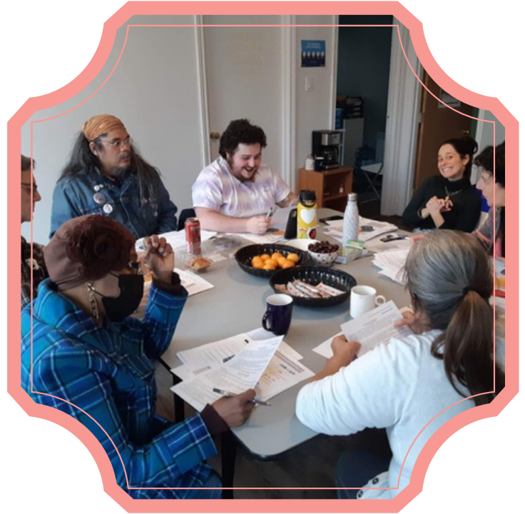
Le comité mobilisation se prépare à rencontrer les élu.e.s provinciaux de l'Est de Montréal en janvier