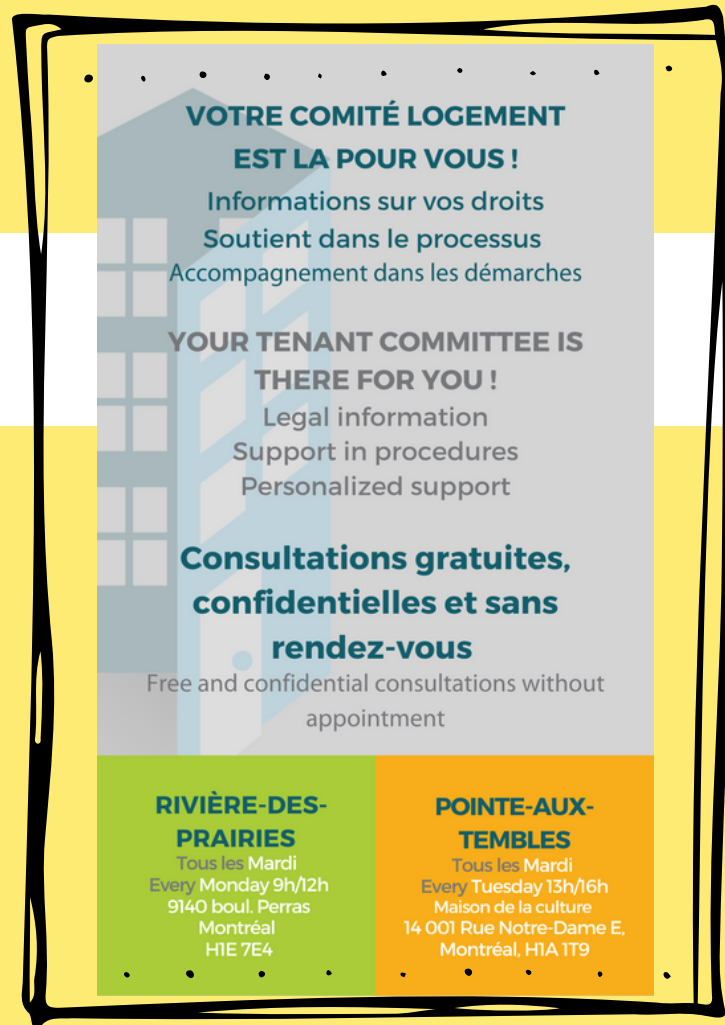
Le dépliant du projet

Infologis déploiera dans les prochains jours deux points de service, un dans les locaux de la Maison de la culture de PAT et l'autre dans les bureaux du centre communautaire de RDP.