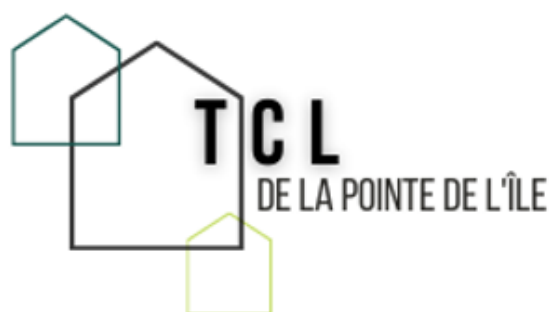
Le logo de la TCL de la Pointe de l'Île

Les rencontres s'enchaînent, la 4ème s'est tenue à Montréal-Est, au Centre Edouard-Rivet en avril dernier. La date de la prochaine rencontre est déjà fixée en juin.