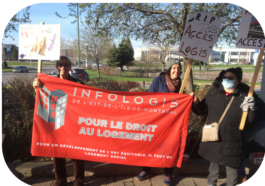
Infologis au Golf d'Anjou, à l'occasion du passage de la ministre Duranceau en avril 2023