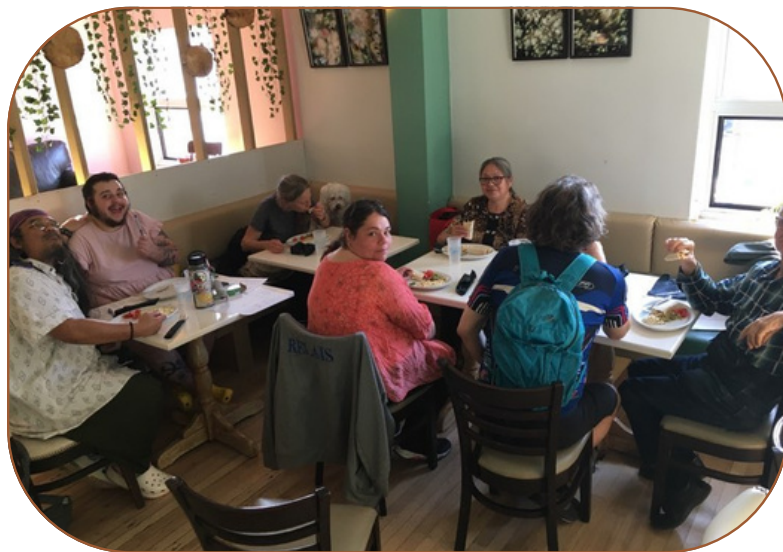
L'ELFE en rencontre à l'Espace Tétro

Dans les mois qui suivirent, le comité a participé à plusieurs actions de revendications au niveau régionale, avec le FRAPRU. À cela s'ajoute l'objectif d'organiser des actions locales.