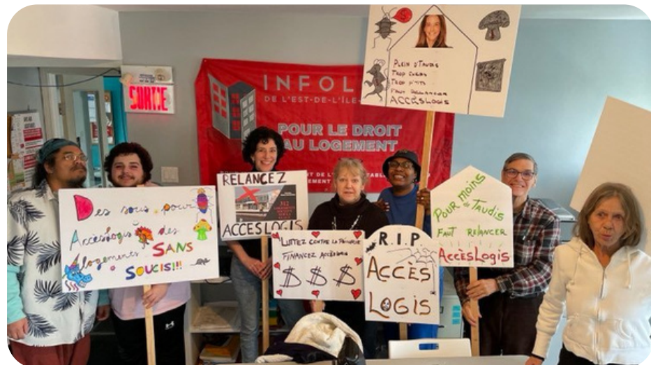
Atelier de création de pancartes pour la manifestation du 16 février