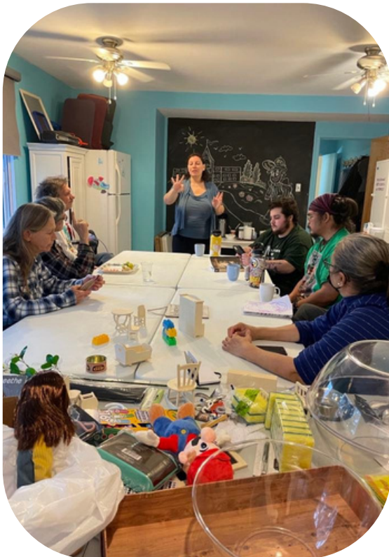
Le comité mobilisation lors d'un atelier créatif en décembre