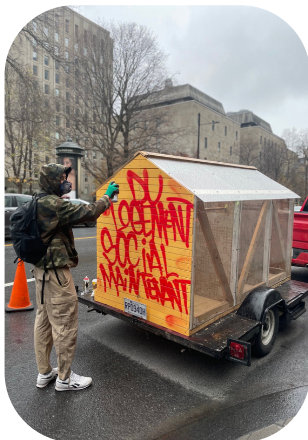
Le char allégorique du FRAPRU lors de son passage à Montréal en novembre 2022