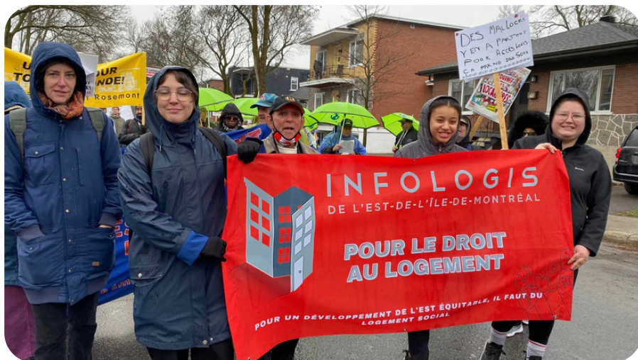
Infologis à la Journée des locataires le 24 avril 2023