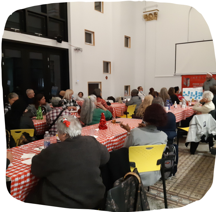
Salle pleine au souper des Fêtes de décembre